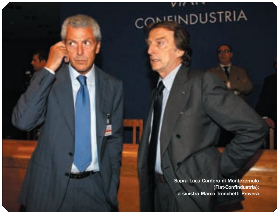
Sopra Luca Cordero di Montezemolo (Fiat-Confindustria); a sinistra Marco Tronchetti Provera