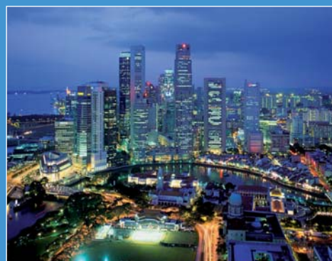
Singapore City vista dall'aereo.