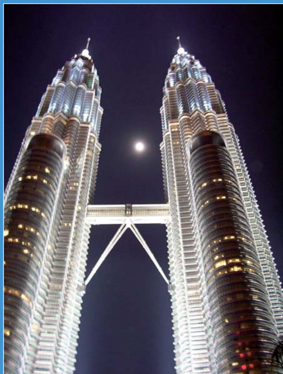
Petronas Twin Towers, Kuala Lumpur (Malesia).