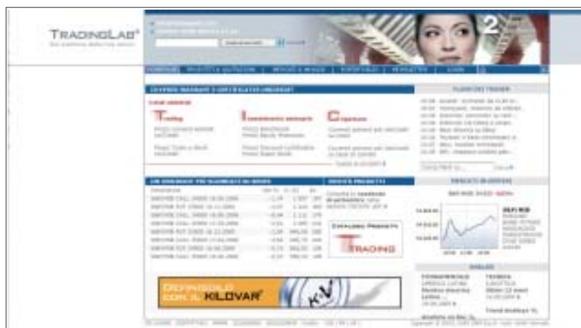
L'home page del sito. A destra in basso si vede un grafico: oltre ai movimenti dei vari indici azionari, offre una fotografia del mercato obbligazionario e dell'euro/dollaro.

se si naviga con una visualizzazione sul browser impostata sia su caratteri "grandi" (scelta diffusa tra gli investitori che usano il pc da casa), sia su caratteri "molto grandi". Come ad esempio avviene per il grafico sulla destra dell'homepage che tende a sovrapporsi all'elenco di voci di cui può fornire l'andamento grafico intraday. Ma è appunto sull'aspetto dell'utilità che il sito si riscatta subito. Proprio questo grafico, oltre ai movimenti dei vari indici azionari, offre con un semplice click un'immediata fotografia dell'andamento del futuro del Bund (indice della tendenza del mercato obbligaziona-