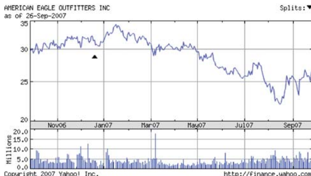
L'andamento in Borsa nell'ultimo anno di American Eagle.