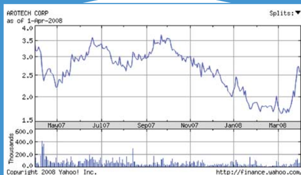
RISTORANTI L'andamento in Borsa nell'ultimo anno della catena americana di ristoranti Carrols.