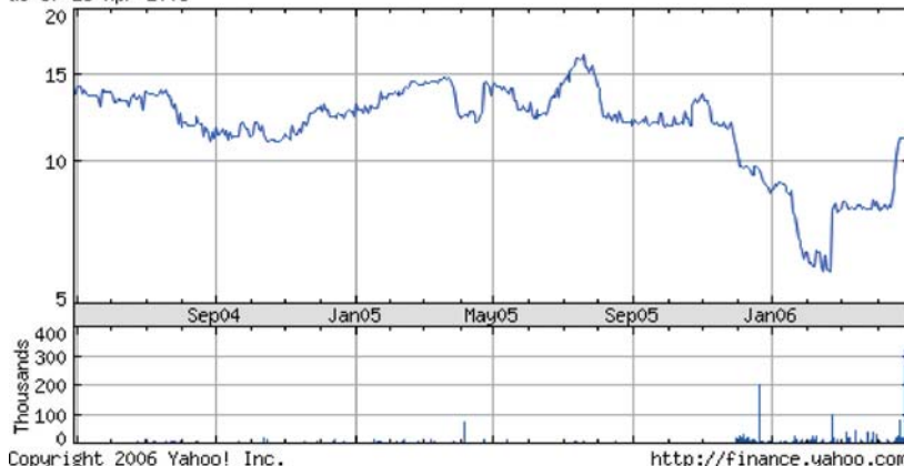
MARSH SUPERMARKETS CLASS B as of 28-Apr-2006

MARSH SUPERMARKETS, INC. L'andamento in Borsa da maggio 2004 di una delle maggiori candidate alla vendita allo scoperto (short).