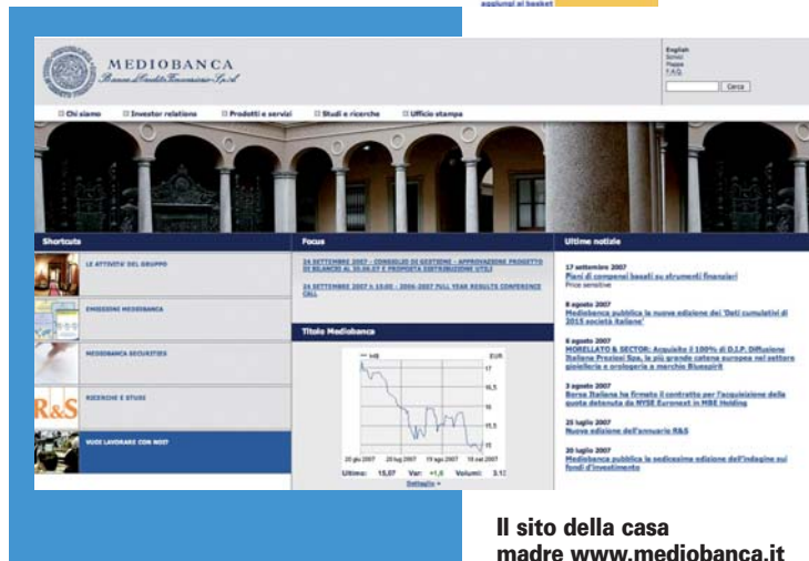
Il sito della casa madre www.mediobanca.it

Oltre agli indici la sezione Ufficio studi offre anche il Rendimento effettivo medio di un gruppo di titoli di Stato e di obbligazioni quotate. Si tratta di una procedura di calcolo iniziata nell'ottobre 1986 volta a determinare il rendimento medio delle obbligazioni quotate in Borsa. I calcoli vengono riferiti sia al comparto dei titoli a tasso fisso che a quello dei titoli indicizzati. Concorrono alla formazione del rendimento medio i titoli con vita residua superiore a 2 anni il cui trattato in valore assoluto risulti superiore a 500 mila euro su base annua. La verifica dei quantitativi trattati sul mercato ai fini dell'inclusione di nuovi titoli viene fatta ogni 3 mesi. Il rendimento medio viene ricavato ponderando i titoli del campione sulla base dei quantitativi trattati. Il rendimento viene calcolato giornalmente con riepiloghi settimanali e mensili. Su questa stessa finestra è disponibile per il downloading un file xls compresso con i rendimenti giornalieri dall'ottobre 1986, un file pdf con la metodologia e un file pdf con le elaborazioni aggiornate all'ultima verifica quadrimestrale. Le rilevazioni si propongono di calcolare il rendimento medio dei titoli a reddito fisso quotati in Borsa allo scopo sia di misurare un saggio d'interesse, sia di predisporre un