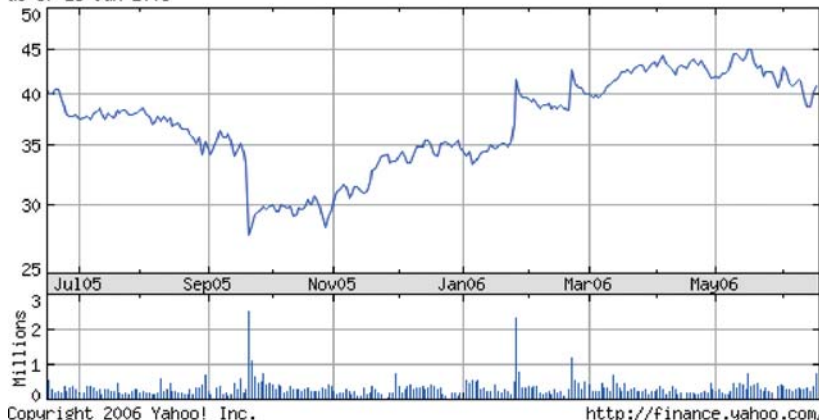
JACK IN THE BOX INC as of 16-Jun-2006

JACK IN THE BOX, INC. Un anno in Borsa del titolo più indicato per puntare al rialzo.