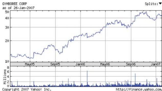
L'andamento in Borsa del titolo Gymboree.