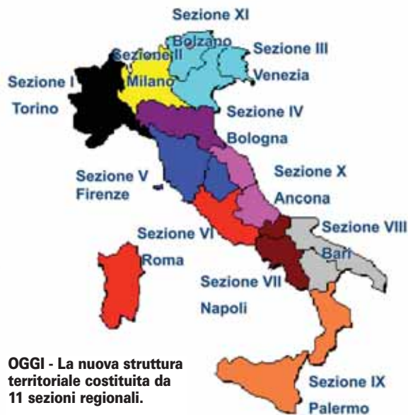
OGGI - La nuova struttura territoriale costituita da 11 sezioni regionali.

Nell'ultimo anno 45 massime sanzioni su 94 provvedimenti della Consob