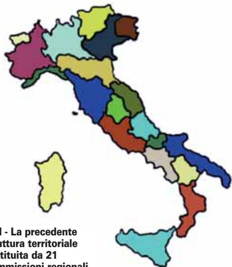
IERI - La precedente struttura territoriale costituita da 21 Commissioni regionali.