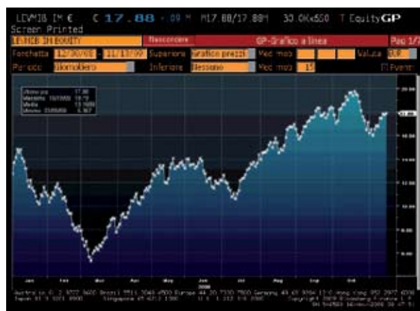
PIAZZA AFFARI L'andamento dell'Etf Lyxor leveraged FTSE Mib dal 30/12/2008 al 13/11/2009.

“ Anche il Lyxor Etf Pan Africa, il primo e unico Etf a investire solo nell’Africa, ha messo a segno un sorprendente + 50% ”