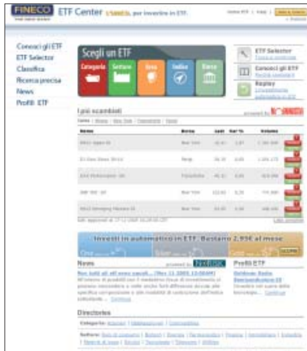
La home page del sito da cui partire per la navigazione e, in alto, la pagina "Conosci gli Etf" con possibilità di ricerca.