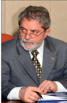
Luis Inacio Lula Da Silva PRESIDENTE BRASILE

La Fed è chiamata a decidere sui tassi americani. Ma le incognite da affrontare per la squadra del presidente Ben Bernanke sono molte e di difficile soluzione. Secondo le ultime stime la crescita dell'economia statunitense è attesa "moderata" nei prossimi mesi, mentre l'impatto della crisi del comparto immobiliare avrà una durata maggiore di quanto previsto in precedenza. Il numero uno della banca centrale americana ha comunque sottolineato che la crisi del comparto immobiliare non ha contagiato direttamente altri settori dell'economia. Da parte sua la Casa Bianca ha rivisto al ribasso le stime di crescita economica del 2007, da +2,9% a +2,3%, e ha anche stimato al 4,5% il tasso di disoccupazione per l'anno in corso, sotto il 4,6% ipotizzato in precedenza. Per il 2008 e 2009 il Pil dovrebbe aumentare del 3,1%, per scendere al 3% nel 2010, mentre la percentuale dei senza lavoro dovrebbe mantenersi stabile per gli anni successivi fino ad attestarsi al 4,8% del 2010. La revisione al ribasso non ha sorpreso il mercato dopo il dato sul Pil del primo trimestre, cresciuto di appena lo 0,6%. Quanto all'inflazione, la Casa Bianca prevede un tasso del 3,2% nel 2007 (dal precedente +2,6%), con l'inversione di rotta nel 2008 (+2,5%) fino al +2,4% e +2,3% degli anni immediatamente successivi.