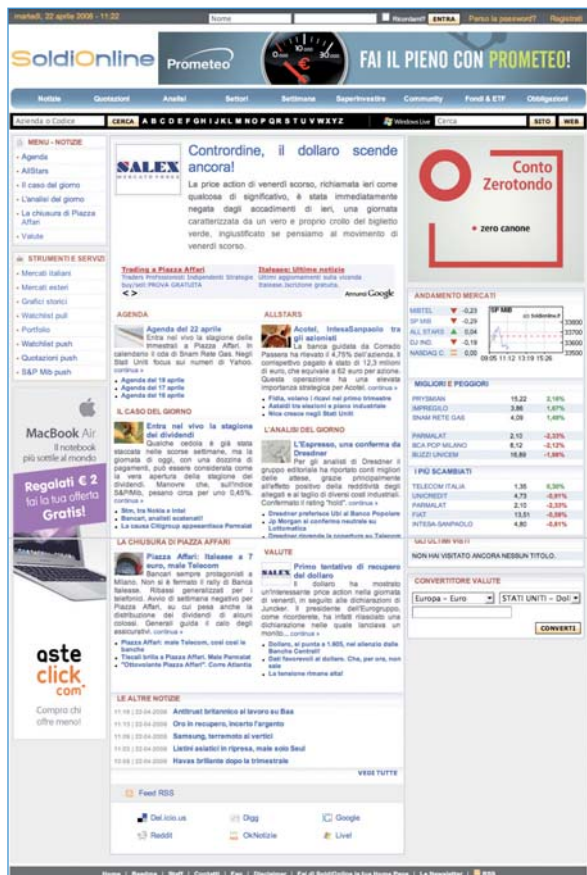
La prima pagina della sezione dedicata alle notizie.